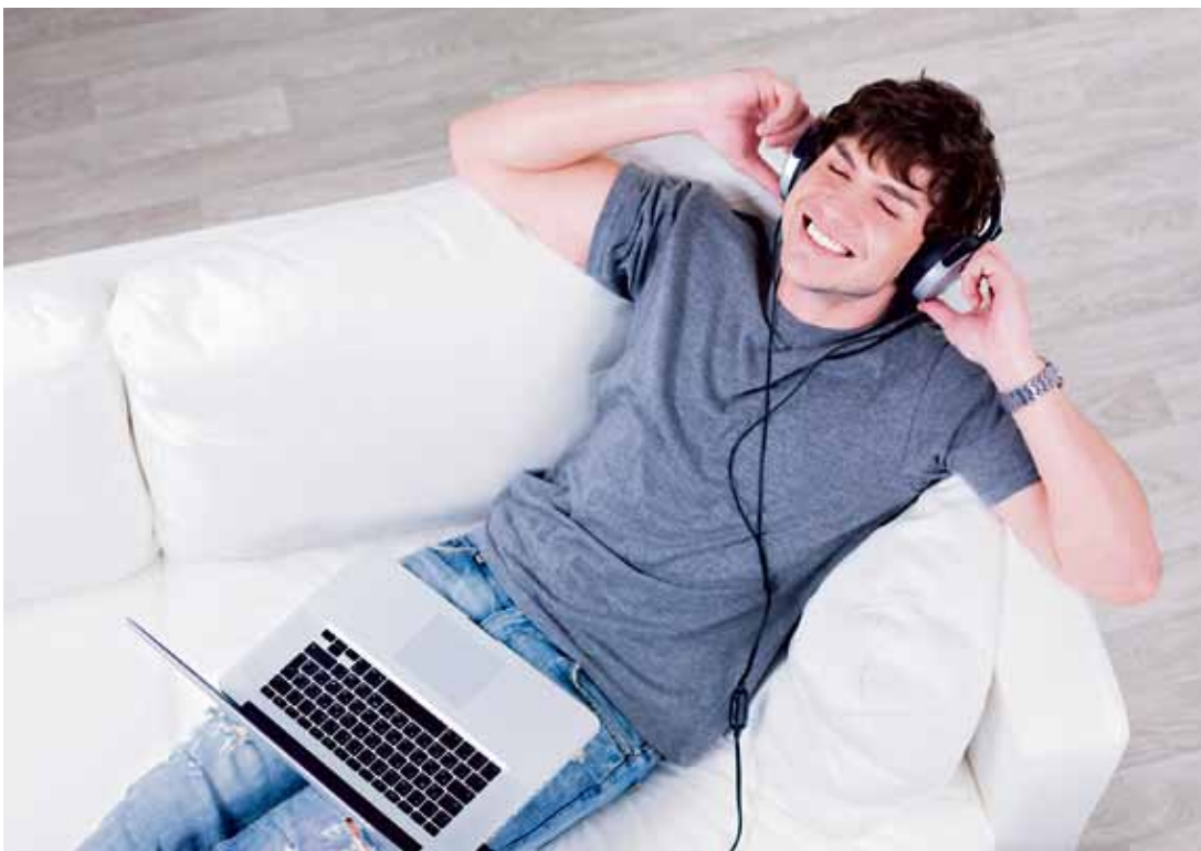
«lockerung der jungen glücklicher mann liegend auf dem sofa mit laptop und musik im kopfhörer hören» (Originallegende).

Musik 1 als diskursive Kunstform zu verteidigen kostet viel. Daher die beliebte und zeitlose Forderung, dies besser anderen Disziplinen zu überlassen. Was mit dem verlockenden Verweis auf Immanenz und Absolutheit allerdings gleich mit ausgeklammert wird, ist die Frage nach dem Preis, den es hat, Musik nicht diskursiv zu verstehen, das heisst vor allem: das Hören von Musik nicht auch als diskursiven Akt zu werten.